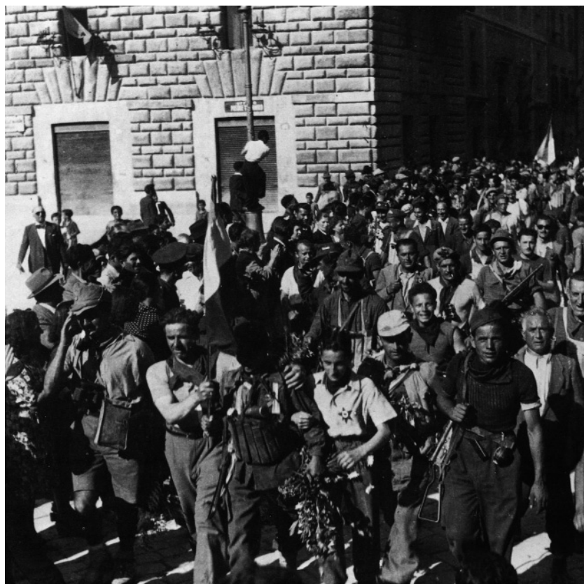
La liberazione di Tolentino, 30 giugno 1944